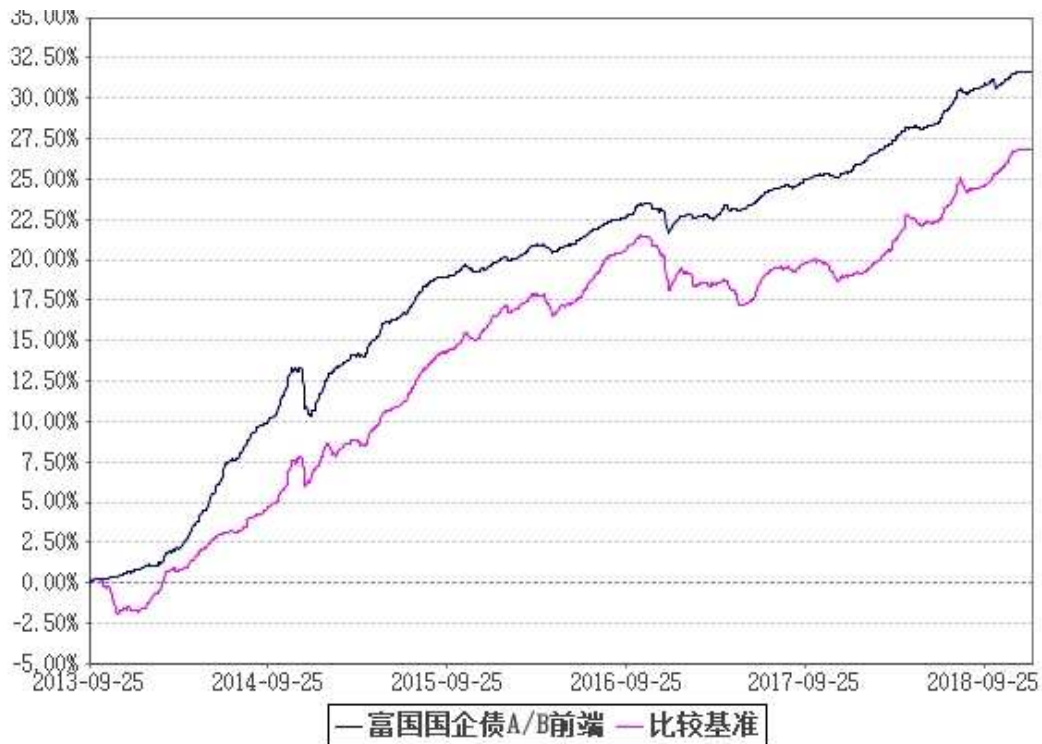
比较基准收益率的历史走势对比图