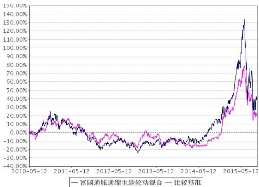
2、自基金合同生效以来富国通胀通缩主题轮动混合型证券投资基金累计份额净值增长率与业绩比较基准收益率的历史走势对比图